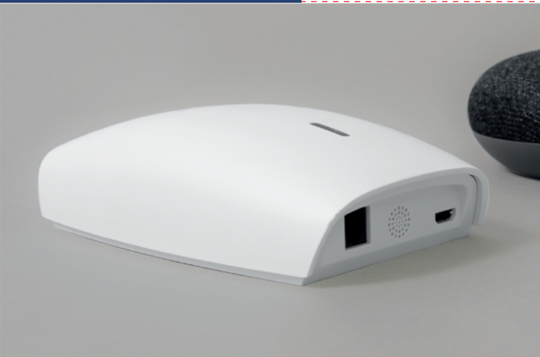
Dwukierunkowa centrala YOODA Smart Home 2 (YSH2_UNIT)