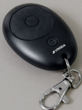
Pilot brelok SIMPLO 1-kanalowy, czarny (SIMPLO_1Rk)